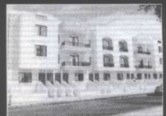
Swieqi Apartments ▲

BT1, BT2, Bulebel Industrial Estate 18, Cardinal Sciberras Street, Qormi Tel: 21486597, 21693633 Fax: 21691796 Mob: 99453147, 99492749 e-mail: k3paints@global.net.mt