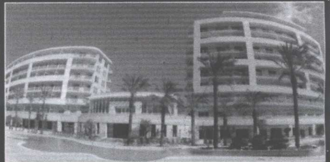
▲ Radisson SAS Golden Sands Resort & Spa

Internal & external plastering and interior & exterior decorations