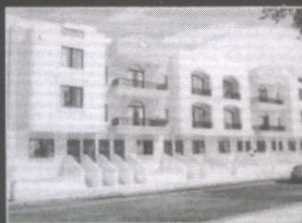
Swieqi Apartments ▲

BT1, BT2, Bulebel Industrial Estate 18, Cardinal Sciberras Street, Qormi Tel: 21486597, 21693633 Fax: 21691796 Mob: 99453147, 99492749 e-mail: k3paints@global.net.mt