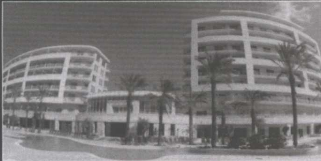
▲ Radisson SAS Golden Sands Resort & Spa

Internal & external plastering and interior & exterior decorations