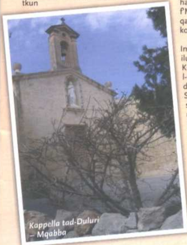
Kappella tad-Duluri – Mqabba

Is-sekli 15 u 16 raw żjieda kbira fil-bini ta' dawn il-knejjes. Fil-fatt fiż-żjara tiegħu fl-1575, Monsinjur Pietro Duzina sab mhux inqas minn 428 bejn kappelli jew parroċċi u