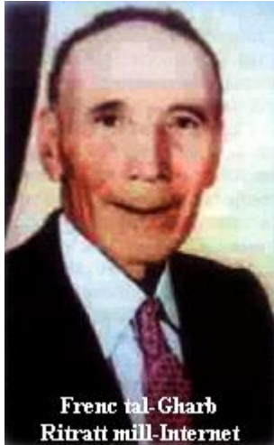
Frenc tal-Għarb

hu kien imfittex wisq għad-duwa li kien jagħti, magħmula minnu stess, mill-ħxejjex. Kien hu li kompli xerred id-devozzjoni lejn il-Madonna Ta' Pinu, u kien hu wkoll li ta bidu għall-Via Sagra li illum iżżejjen l-Għolja ta' l-Għammar, quddiem is-Santwarju.