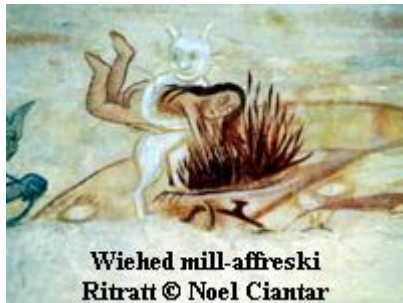
Wieħed mill-affreski

Sfortunatament din il-knisja ġiet attakkata għal aktar minn darba mill-furbani Torok. Rigward dawn l-attakki nsibu diversi stejjer u tradizzjonijiet fosthom li, minhabba s-serq ta' spiss li kien isir minn din il-knisja, it-teżori li kienu jinstabu fiha kienu ġew moħbija f'oqbra fil-knisja u skont storja oħra dawn ġew mitfugħa ġo bir viċin l-knisja, flimkien mal-qniepen l-antiki li kien hemm fuq il-kampnar tagħha.