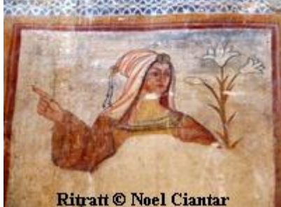
Ritratt © Noel Ciantar

Matul ir-restawr tal-knisja li nbeda fl-1973, wara li tneħhew sitt saffi ta' kisi, inkixef affresk faċċata tal-bieb ta' barra. L-affresk imur lura sas-16-il Seklu. Dan l-affresk inkixef bejn l-1978 u l-1980. Għalkemm baqgħalna biss ftit biċċiet mill-affresk oriġinali, m'hemmx dubju li s-suġġett huwa l-Gudizzju Universali tal-aħħar tad-dinja. Dan huwa mqassam fi tliet saffi ta' figuri.