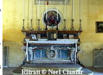
Ritratt © Noel Ciantar

Meta d-Delegat Appostoliku Monsinjur Dusina żar lil Bir Miftuh fl-1575, sab lil din il-knisja fi stat tajjeb ħafna biex isservi l-Uffiċċju Divin. Hu semma li l-knisja kellha żewġ artali li t-tnejn kienu ddedikati lill-Assunta; għaldaqstant hu rrakkomanda li wieħed minnhom jinbidillu d-dedika. Peress li din il-knisja, bħal oħrajn bħalha, kienet tintuża għad-dfin, Monsinjur Dusina rrimarka li għandhom jithaffru oqbra aktar addattati minn dawk li kien hemm f'nofs il-knisja. Fi żmien iż-żjara ta' Monsinjur Dusina fl-1575 insibu li l-parroċċa ta' Bir-Miftuh kienet tħaddan 55 knisja filjali.