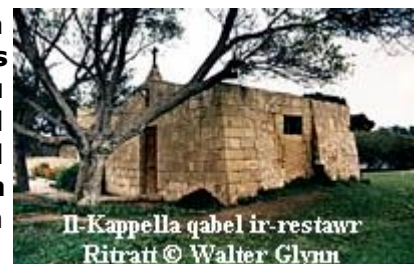
Il-Kappella qabel ir-restawr

Matul is-snin kemm it-temp kif ukoll elementi oħra għamli hafna hsara lill-bini tal-kappella u kienu biss il-Marsa Sports club li hadu hsieb jagħmlu manutenzjoni fejn meħtieġ u żammewha 'l bogħod mill-vandalizmu ta' xi nies irresponsabbli. Izda għal xi żmien din il-kappella kienet giet minsija, mitluqa u abbandunata, u f'dan il-perjodu saritilha hafna hsara.