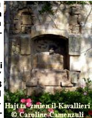
Hajt ta' żmien il-Kavallieri