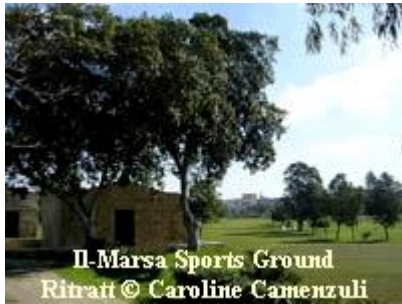
Il-Marsa Sports Ground