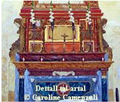
Detall tal-artal

Ma nistghux ngħidu li kienet waħda mill-kappelli, biex ngħidu hekk sinjuri, iżda ma kienitx nieqsa lanqas. Meta f'din l-istess sena , 1763, l-Isqof Bartolomeo Rull kien ħareġ digriet biex il-prokuraturi kollha tal-kappelli filjali jagħtu sehmhom biex jinxtraw paramenti ġodda għall-knisja parrokkjali tan-Naxxar, il-prokuratur tal-kappella kien ħareġ is-somma ta' 40 skud li għaddiha lil Veneranda Lampada. Aktar qabel, fil-vista pastorali tal-Isqof Cannaves fl-1716 hemm miktub li fil-kappella kien hemm madwar 20 kwadru