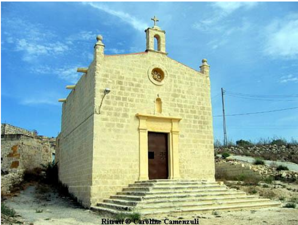
Ritratt © Caroline Camenzuli

Fis-Salina hemm kappella żgħira u antika ħafna, li jgħidhula "l-Imdawwra". Din hi ddedikata lill-Arkanġlu San Mikiel, u ħadd ma jaf eżatt meta nbriet. Li jafu żgur hu li hija antika ħafna, għax issemmiet f'diversi rapporti ta' Viżti Pastoralni antiki.