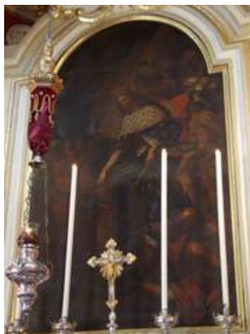
San Luigi IX