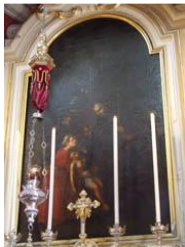
San Mauro Abbati