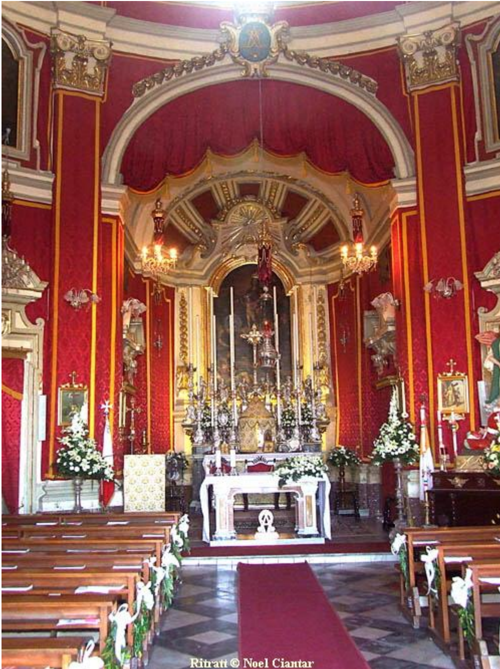
Ritratt © Noel Ciantar