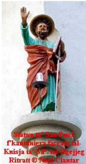
Statwa ta' San Pawl f'kanniera faċċata tal- Knisja ta' S.P. tal-Ħġejjeg